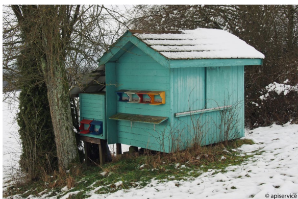
Rucher en hiver

Les photos suivantes peuvent être téléchargées dans l'espace presse d'apisuisse : www.abeilles.ch/actualites/presse