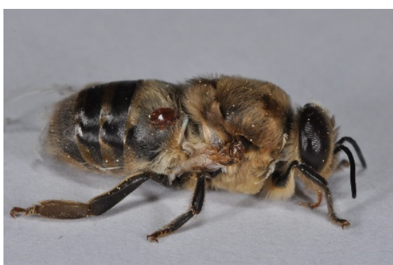
Faux bourdon victime du varroa avec les ailes déformées