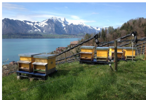
Ruches au printemps