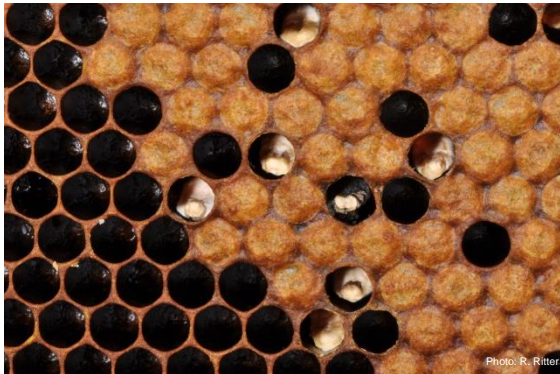
Cadre avec couvain calcifié

Les momies se décolorent en fonction de l'évolution du champignon. D'abord blanches, elles deviennent grises, puis noires quand les filaments forment les sporophores.