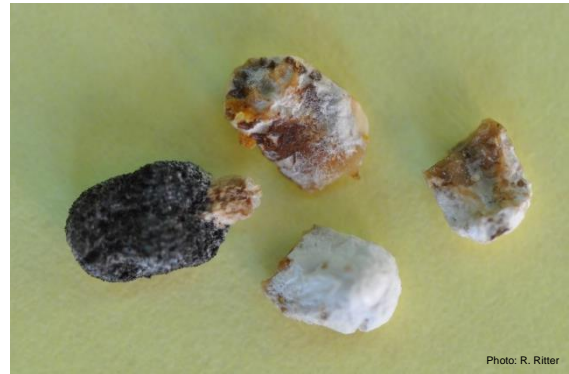
Momies de couvain calcifié blanches et noires